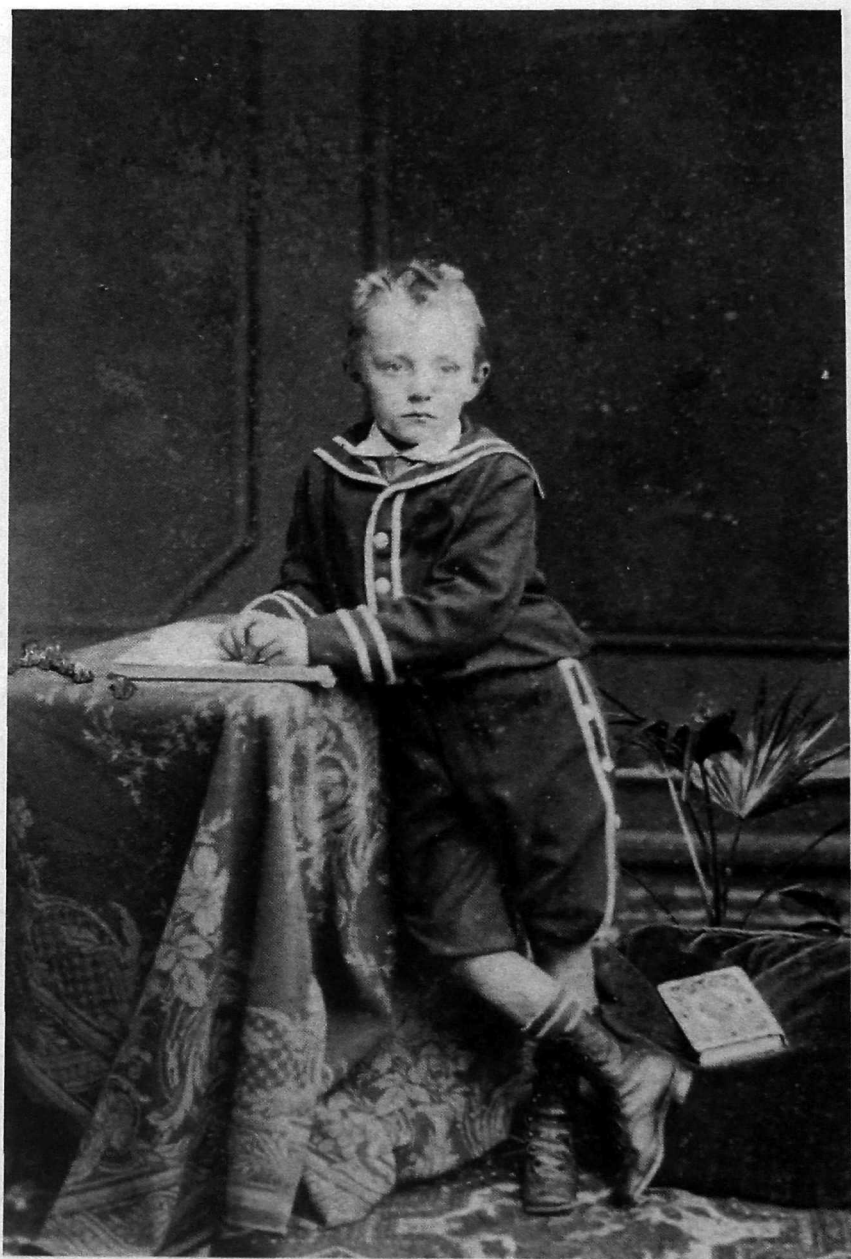
▲ Paul Otlet petit garçon. Dès son plus jeune âge, il se fait photographier avec un livre à la main. Il conservera cette habitude toute sa vie.